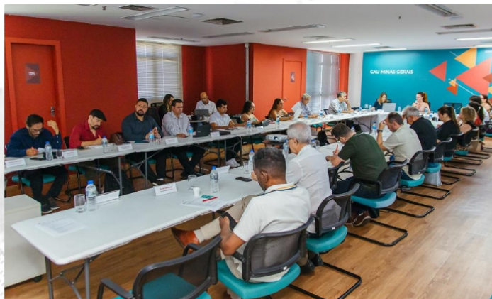
Imagem: Criação da Comissão de Apoio Técnico ao Profissional foi aprovada na 147ª Plenária do CAU/MG

A iniciativa, aprovada na 147ª Plenária do CAU/MG, foi uma das primeiras propostas da gestão de 2024-2026, e é um passo importante para o fortalecimento do trabalho dos arquitetos (as) e urbanistas no estado.