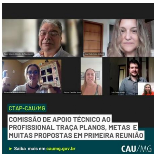
Imagem: CTAP-CAU/MG – Primeira Reunião Disponível em: https://www.instagram.com.br/caumg

A primeira reunião da CTAP-CAU/MG ocorreu por videoconferência no dia 13 de março de 2024, em que foram discutidos os seguintes assuntos: