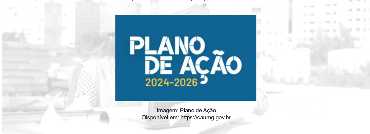
Imagem: Plano de Ação